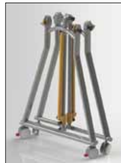
▲担架Sサイズ 担架両側にサイドレール（オプション）装着時

仕様 ●担架外寸／Lサイズ：1,680(L) × 585(W) mm、Sサイズ：1,430(L) × 585(W) mm ●トロリー（下部）／1,430(L) × 705(W) × 852(H) mm ●重量／トップ：8kg、ベース部：8kg、計 16kg、サイドレール（オプション）：1kg（1本当たり） ●材質／トップ：ビニール製、キャリア：アルミニウム製 ●最大荷重／120kg