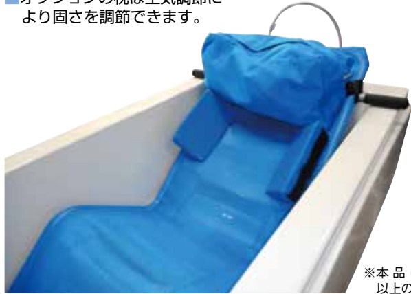
▲写真は枕（オプション）付きです。