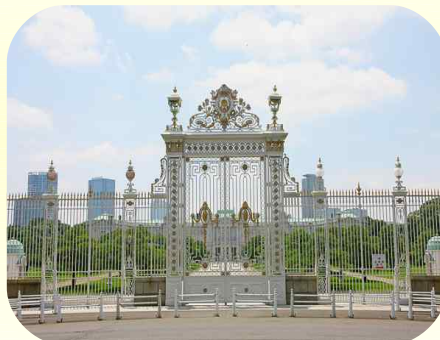
赤坂迎賓館 (車窓見学)