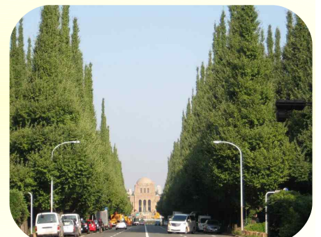
聖徳記念絵画館 (下車観光)