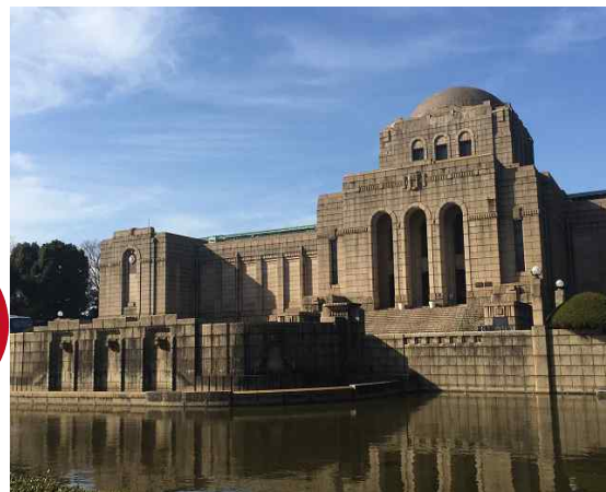
明治の歴史が一目で判る聖徳記念絵画館