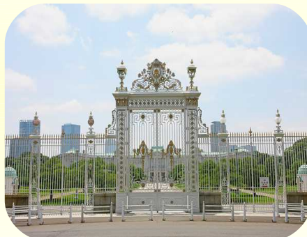
赤坂迎賓館 (車窓見学)