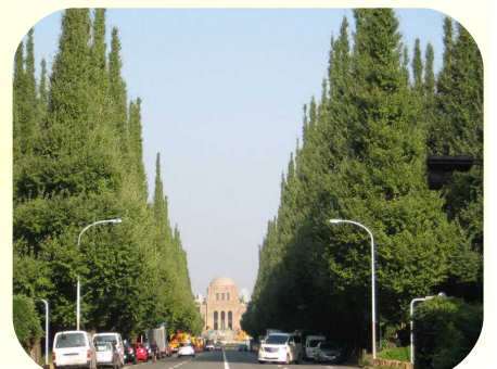
聖徳記念絵画館 (下車観光)