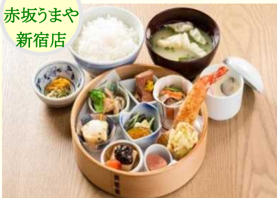
ご昼食: 三代目市川猿之助の楽屋めし