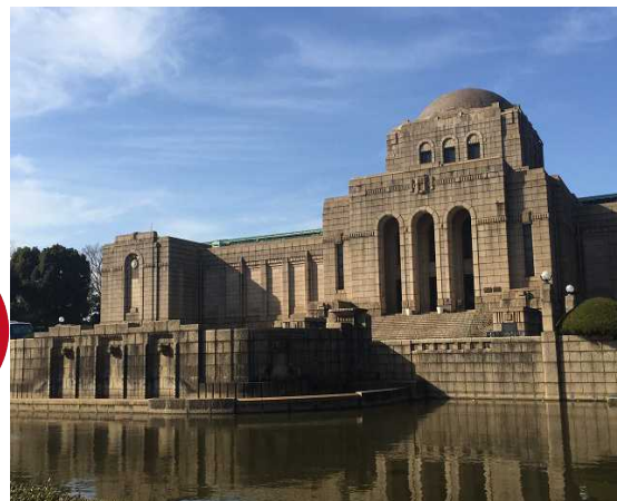
明治の歴史が一目で判る聖徳記念絵画館