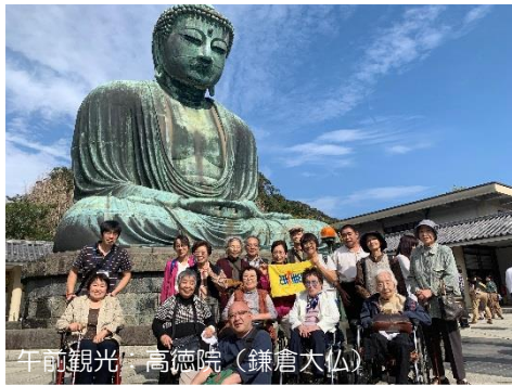
午前観光: 高德院 (鎌倉大仏)