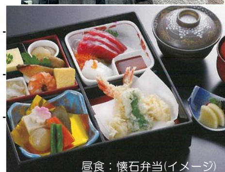
昼食：懐石弁当(イメージ)