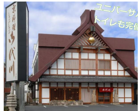
昼食は鎌倉の寺院御用達の御代川にて