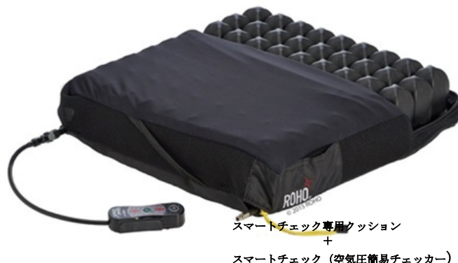
スマートチェック (空気圧簡易チェッカー)