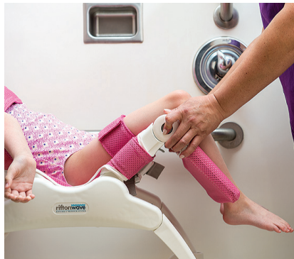
座面と脚載せ部分もシンプル調整

背もたれの角度調整は、背面のハンドルを握って動かすだけ。お使いになる方の様子を見ながら片手で簡単に行なえます。