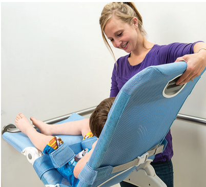
片手でできる、背もたれ調整

背もたれの角度調整は、背面のハンドルを握って動かすだけ。お使いになる方の様子を見ながら片手で簡単に行なえます。