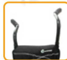
高さ調整式 プッシュハンドル

折りたたみが簡単で、高さ調節可能なプッシュハンドル、調節可能なアームレスト、パッド入りの調節可能な背もたれなど、考え抜かれたデザインは、ご両親に喜ばれることでしょう。