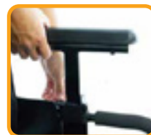
着脱式 & 高さ調節可能 アームレスト

圧倒的な自由度と快適さを求めて Zippie イージー ゴー をお選びください！