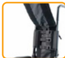
調節可能な ベルクロストラップ