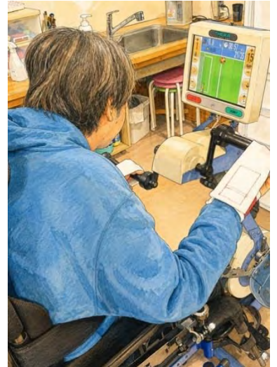
マシンで上肢のトレーニング中のT氏