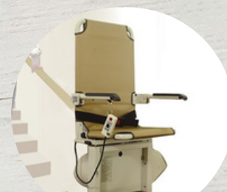
スーパーレーターβスリム