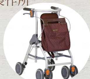
テイコブリトルスリム