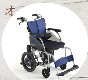
ミライトウィング