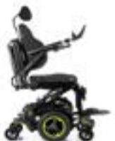
リフト昇降 (シーミー)