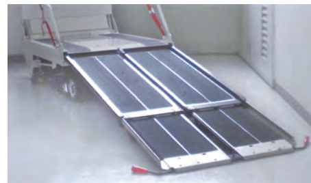
▲引き出し式スロープ