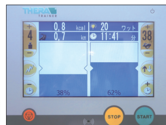
▲バイオフィードバック画面①