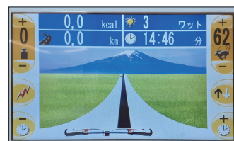
▲バイオフィードバック画面②