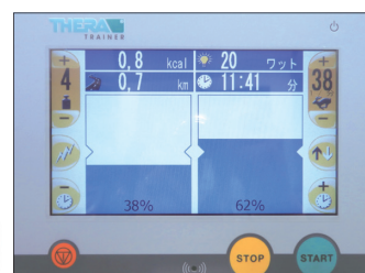
▲バイオフィードバック画面①