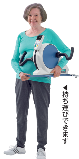
▲持ち運びできます

●寸法／ペダル装着：幅 46 × 長さ 50 × 高さ 43cm、ハンドル装着時：幅 56 × 長さ 50 × 高さ 43cm ●自重／ペダル装着時 13.2kg、ハンドル装着時 12.1kg ●電源／AC100 ～ 240V 50/60Hz ●ペダル回転スピード／1 ～ 60rpm ●トルク／約 2 ～ 8Nm