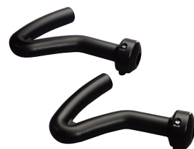
専用ハンドルとペダルが付属。

デイサービス・有料老人ホーム・特養・障害者施設・ デイケア・老健施設・病院等だけでなく、ご家庭にも最適