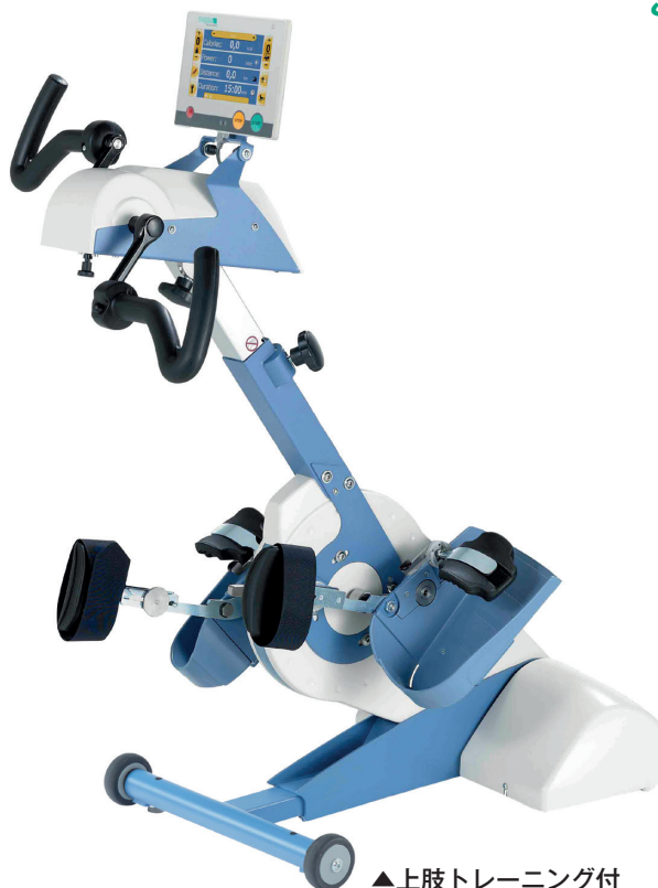
▲上肢トレーニング付