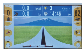
▲バイオフィードバック画面②