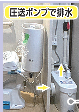
圧送ポンプで排水

高さ3m、水平距離60mまでの排水能力を持つ圧送ポンプにより、設置場所の自由度が広がります。